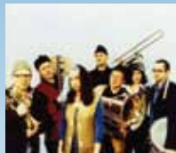
Schäl Sick Brass Band