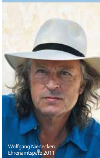
Wolfgang Niedecken Ehrenamtspatre 2011